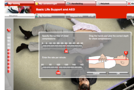
Kennisdesk® Doczero Academy